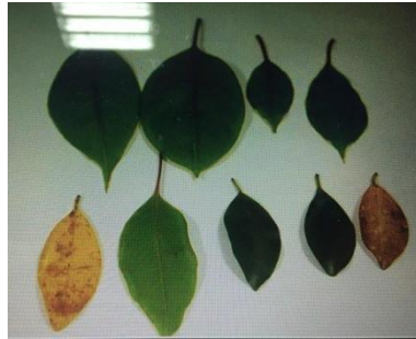
準備好收集的葉片