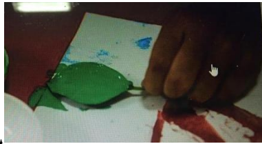
將葉片塗上需要的顏色