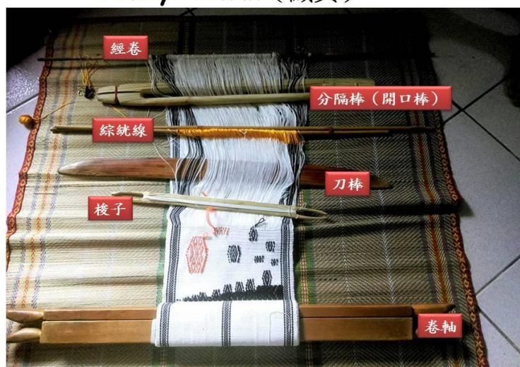
Gaya Cinun (織具)